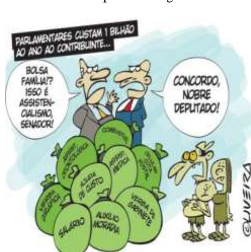
FIGURA 4: Exemplar de charge 4