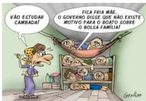
FIGURA 1: Exemplar de charge 1

Fonte: Charge publicada no site Charge Genildo. Boatos sobre o Bolsa Família, 2013. <Disponível em: http://www.genildo.com , 2013. Acesso em: 16 abr. 2019.