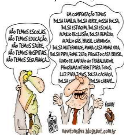
FIGURA 3: Exemplar de charge 3