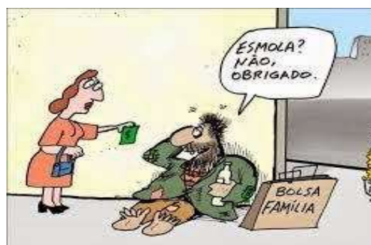
FIGURA 2: Exemplar de charge 2

Fonte: Charge publicada no site Café com Sociologia. Superestrutura e ideologia: tomando como exemplo as Ideias difundidas sobre o Bolsa Família, 2015. Disponível em: https://www.cafecomsociologia.com/programa-bolsa-familia-alguns-juizos-de/ Acesso em: 16 abr. 2019.