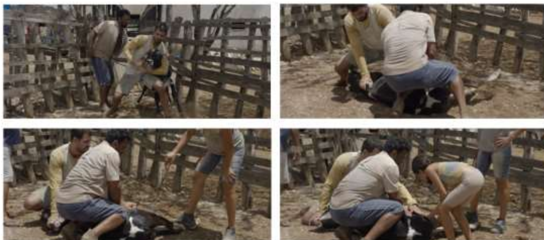
Figuras 3 – Frames I, J, K, L. (47min e 43seg)

Na última cena a ser analisada, a presença dos dois personagens se faz agora sob uma nova configuração. Ao contrário das cenas anteriores que ressaltavam a tomada de posição contrária aos estereótipos da tradição, nas imagens abaixo a construção sígnica amarra a problemática do novo versus velho em um tom de diálogo e não de antagonismo: