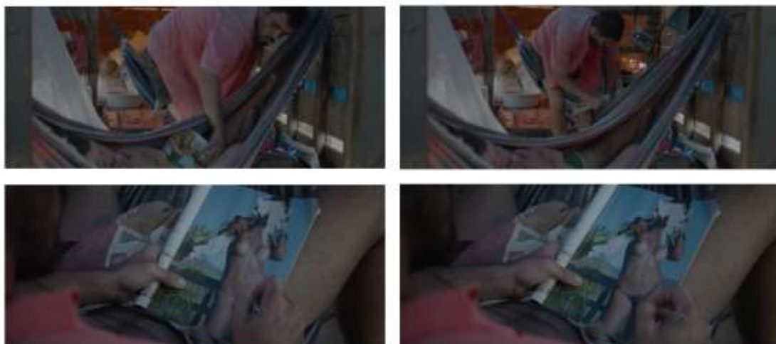
Figuras 2 – Frames E, F, G, H. (25min e 56seg)

O mesmo direcionamento de sentidos que destaca essa quebra de estereótipos entre lugares sociais, bem como o choque cultural entre moderno versus arcaico é apresentado na cena seguinte, em que figura o personagem Iremar, representado por Juliano Cazarré. Na cena em questão, composta por dois enquadramentos, o personagem vai ao encontro da rede em que seu parceiro está dormindo e pega sorratamente uma revista erótica, com mulheres nuas: