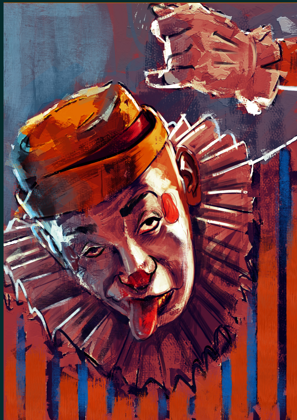
Ilustração da Capa Vito Quintans Paraíba